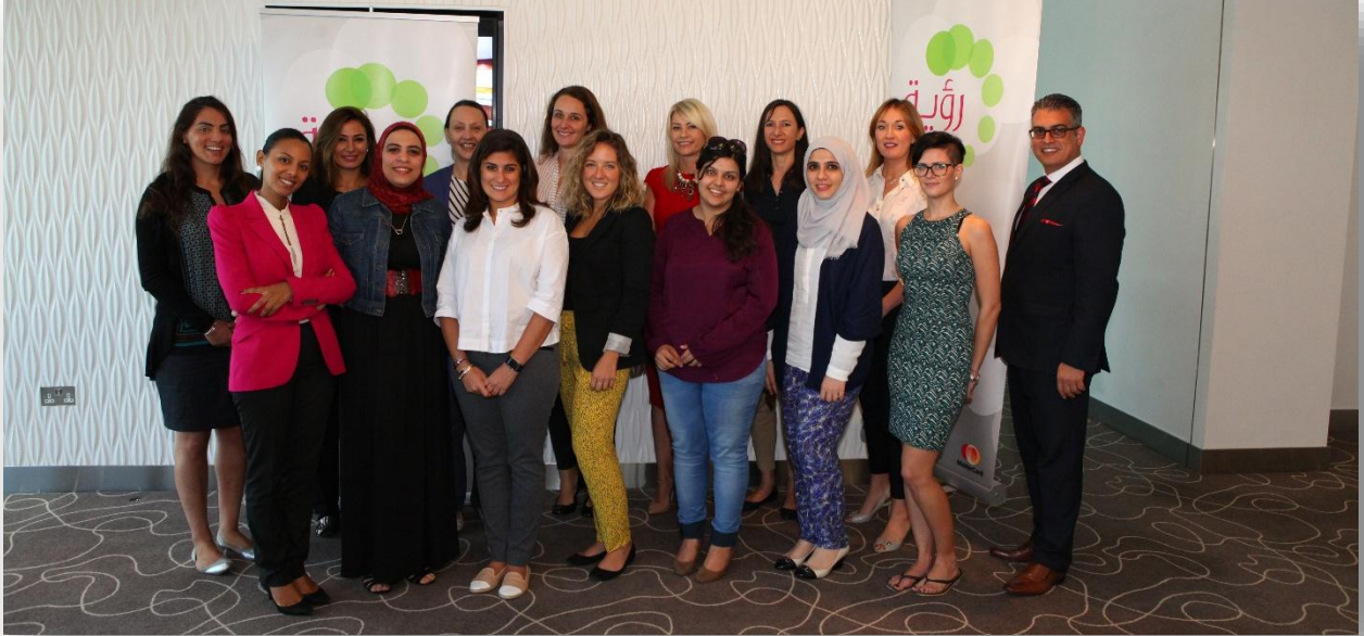
*Group Photo – Ro'Ya 10 Shortlisted Applicants